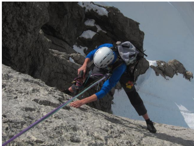
Einbohren der 2. SL