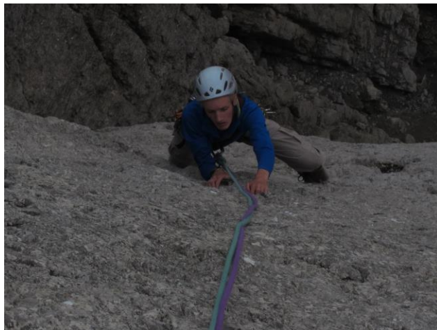
Platte nach dem Überhang der 2. SL

2. SL: Über zunehmend schwierigere Platten (5, 6-) zu Überhang. Über diesen (7-) und die folgenden Platten (6) leicht links haltend zu Stand an 2 BH knapp unter dem Grat, Wandbuch. (35m, 7-, 4 Zwischen-BH)