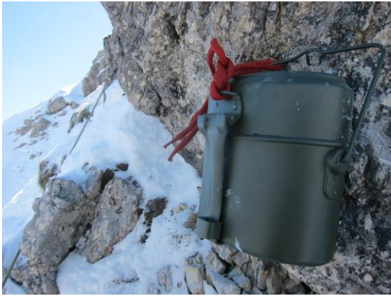
Wandbuch am 6. Stand

7. SL: Durch die Verschneidung und zunehmend leichter über schöne Turfstufen (BH) zu Stand am Gipfelkreuz; Schlinge mit AS-Öse. (25m, M3-, 1 BH)