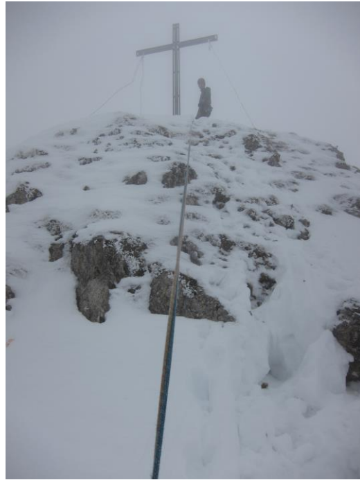
Ausstieg zum Krinnespitzgipfel, 7. SL