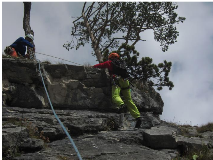
Überhang am Ende der 3. SL ↓

3. SL: Rechts einige Meter über Grasband zu Platte und diese hinauf (3 BH, 1 SU, F2; 6+) und etwas leichter zur nächsten Platte unter Dach. Über die Platte (2 BH, 6-) zum Dach und über dieses (BH, 6) zu Platte und etwas leichter weiter zu Stand an Baum mit Schlinge und AS-Öse. (35m, 6+, 7 BH, 1 SU, F2)