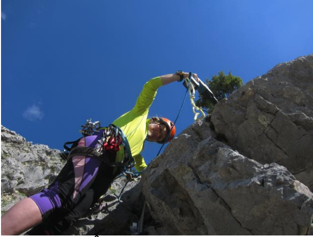
Mitte der 1. SL ↑

1. SL: Über Platte rechts von Verschneidung hinauf (BH, SU, 6-) und links über leichteres Gelände (2) zu Latsche. Immer entlang der plattigen Kante (3 BH, SU, Friends; max. 5+) zu Stand an 2 BH unter Steilstufe. (45m, 6-, 4 BH, 2 SU, Friends)