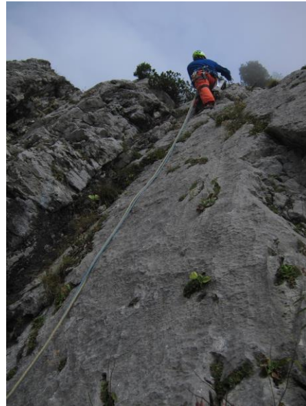
Kurz nach dem Einstieg →

1. SL: Über Platte rechts von Verschneidung hinauf (BH, SU, 6-) und links über leichteres Gelände (2) zu Latsche. Immer entlang der plattigen Kante (3 BH, SU, Friends; max. 5+) zu Stand an 2 BH unter Steilstufe. (45m, 6-, 4 BH, 2 SU, Friends)