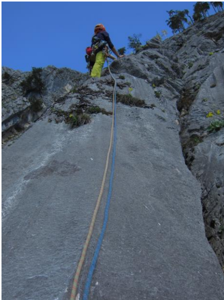
Pfeiler am Ende der 1. SL ↑

2. SL: Links ansteigend über Band (SU, F2,5; 4 und 3) zu Platte. Diese gerade hinauf (3 BH, 5) zu Stand unter Grasband an 2 BH. (40m, 5, 3 BH, 1 SU, F2,5)